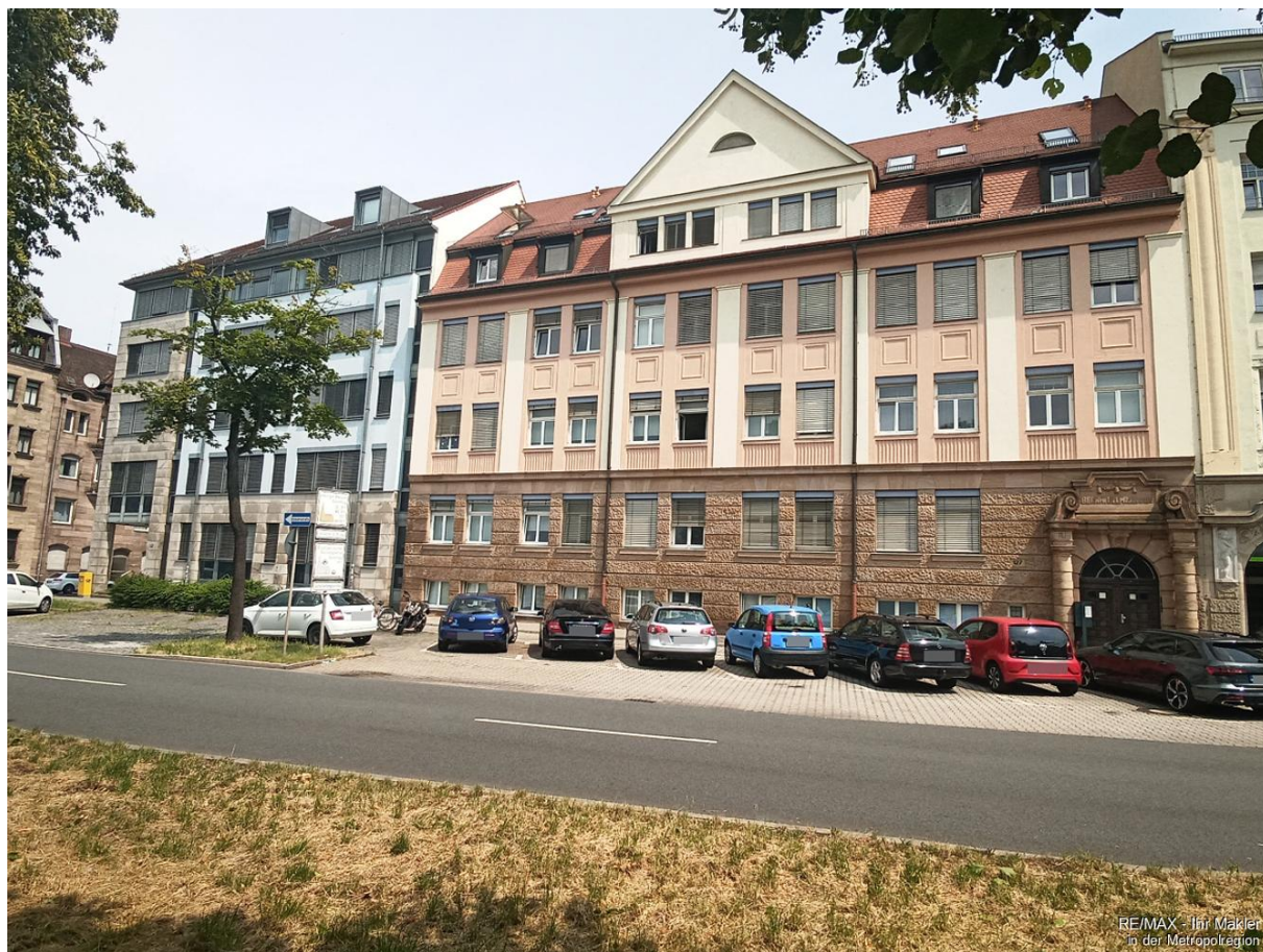
RE/MAX - Ihr Makler in der Metropolregion