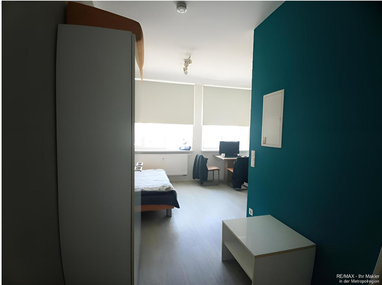
RE/MAX - Ihr Makler in der Metropolregion