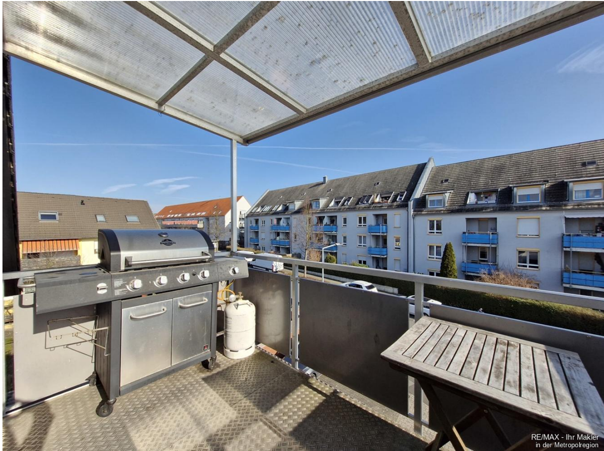
RE/MAX - Ihr Makler in der Metropolregion